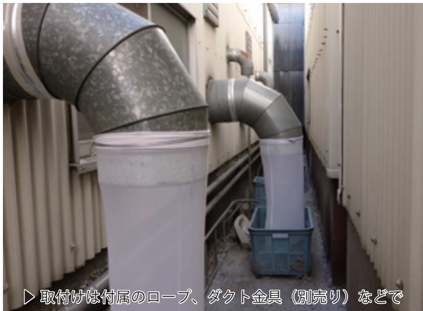
▶ 取付けは付属のロープ、ダクト金具 (別売り) など

参考価格 ¥ 3000 (税別) (A)φ300 mm × (B)1000 mm ※ダクト取付け金具は付属していません