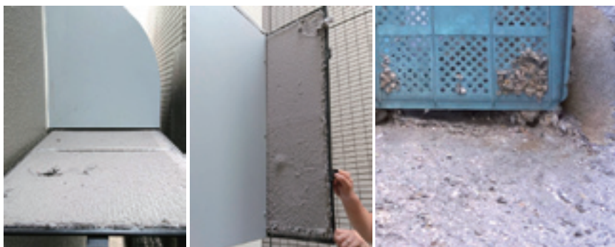
▶ 工場の排気ダクト周辺は汚れていませんか？